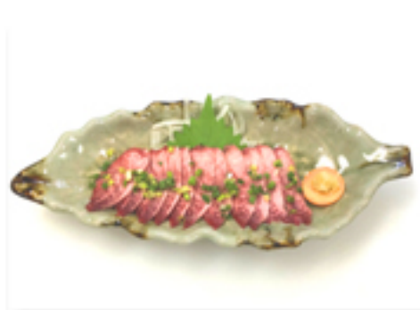
馬タン刺 1,480 円 (他店ではあまり置いていない 珍しい1品)