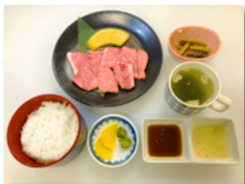
かのや定食 2,280 円 (本格黒毛和牛のロースを使用。 創業以来の定番メニューです。)