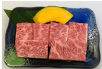
スペシャルカルビー 2,280 円