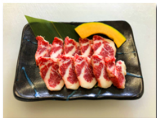
馬バラヒモ焼肉 1,980円