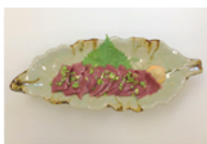
馬心臓刺 980 円 (珍味のひとつ)