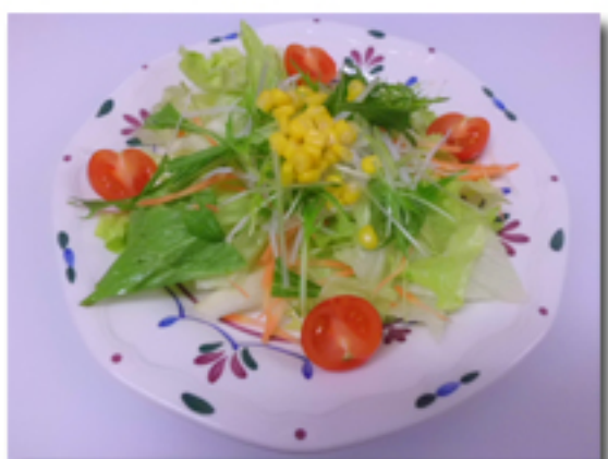
彩りサラダ 650 円

レタス、大根、人参、水菜 カーネルコーン、ミニトマトの 彩り豊かな新鮮野菜を シーザードレッシングでどうぞ。