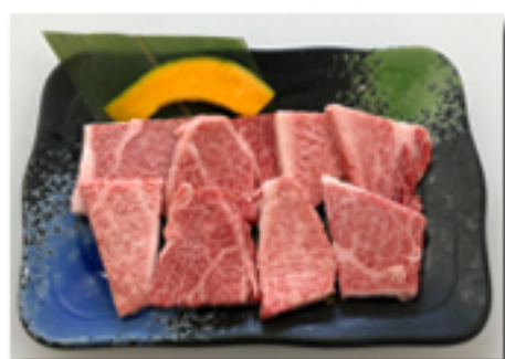
● 鹿屋ロース 1,880 円 (本格黒毛和牛のロース)