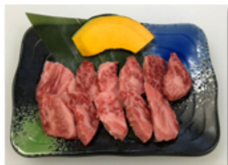
● 中落ちカルビー 1,880 円 (売り切れ御免の商品です。)