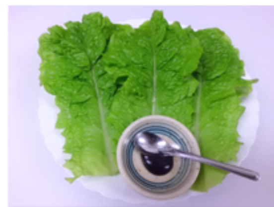
サンチュ 350 円