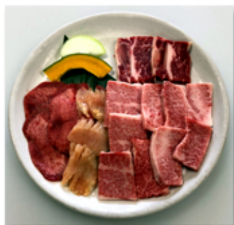
牛焼肉盛合せ 2,880 円 (量は約 1.5 人分)