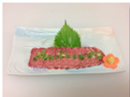
特トロ馬刺 2,180 円 (馬刺の最高峰、霜降りが美しい)