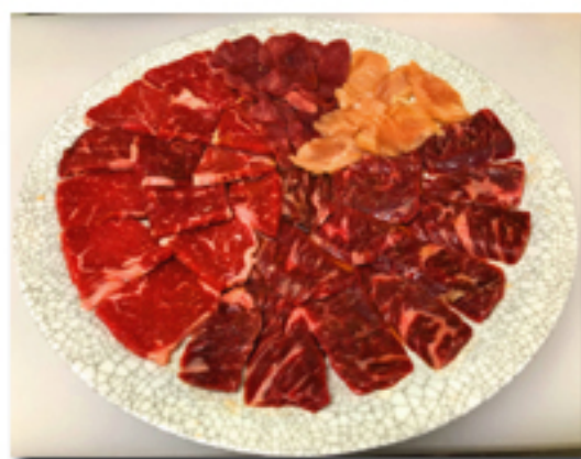
まんぷく盛合せ 4,380 円

(鹿屋ロース、鹿屋カルビー、桜ロース、 馬厳選焼肉の4種盛り、フランクフルト2本)