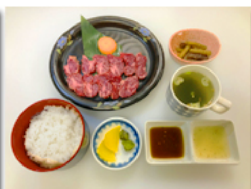
さくら定食 2,380 円 (馬の極上焼を使用。 馬肉の定食です。)