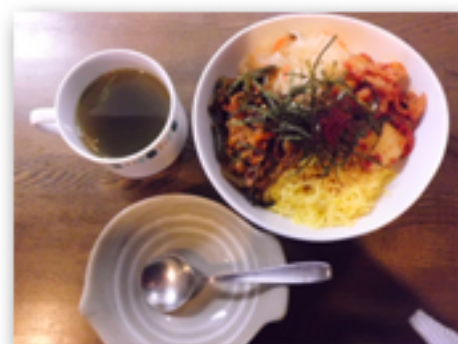
かのや特製ビビンバ 880 円 (わかめスープ付)