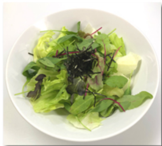
チョレギサラダ 580 円