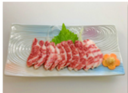
大トロ馬刺 1,880 円 (店長いわく、馬刺として 食べる部位では最高の味。)