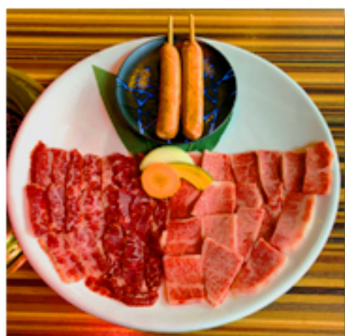
デラックス盛合せ 6,580 円