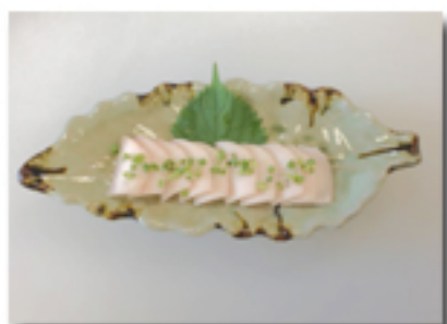
タテガミ刺 780 円 (甘く、まろやかな味わい)