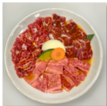
カルビーミックス盛 4,380 円