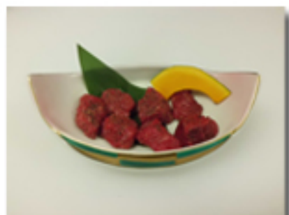
ヒレコロステーキ 1,880 円

単品のお肉の量はすべて 1 皿 100 g です。 ただし、牛焼肉盛合せは 250 g です。