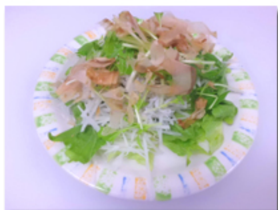
ジャコと大根サラダ 680 円