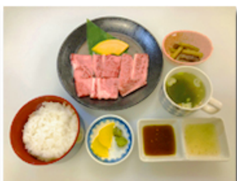
みよし定食 2,180 円 (本格黒毛和牛のカルビー使用。 創業以来の定番メニューです。)