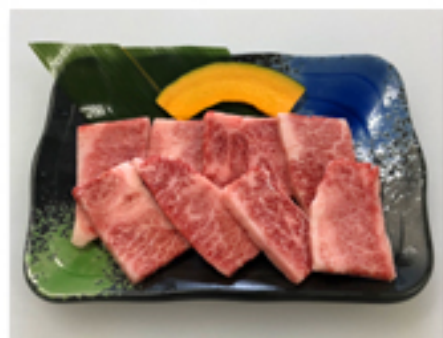
● 鹿屋カルビー 1,780 円 (本格黒毛和牛のカルビー)