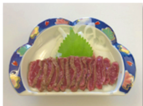
馬刺のタタキ 1,880 円 (スパイスの効いたタタキを 当店特製タレで)