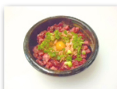
桜納豆 880 円 (馬のユッケ的存在)