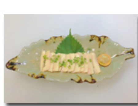
根っこ刺 1,080 円 (心臓近くの太い血管で コリコリとした食感が特徴)