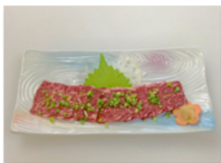
赤身馬刺 1,680 円 (赤身がお好きな方に)