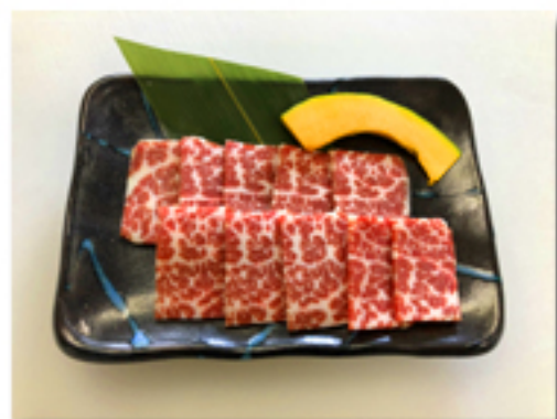
スペシャル桜焼肉 2,880円

*馬の焼肉はタレ焼きか、塩焼きが選べますので ご注文の際、係の者にお申し付けくださいませ。)