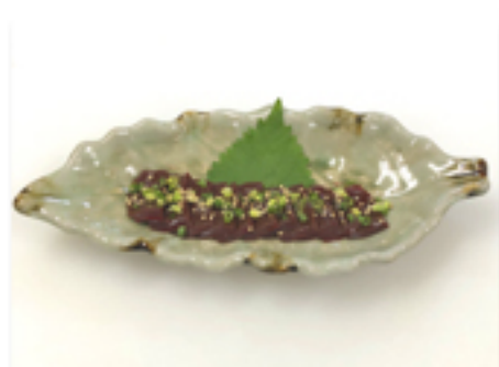
馬レバー刺 1,580 円 (当店人気メニュー、 売切れ御免。今や、貴重品。)