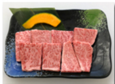
スペシャルロース 2,380 円