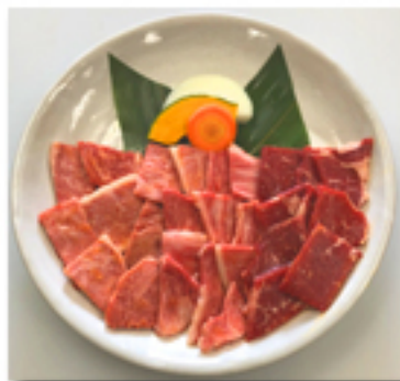
ロースミックス盛 4,680 円